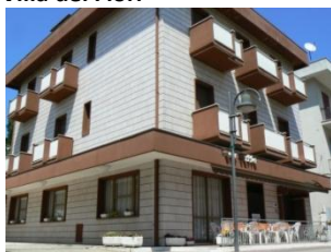
Villa dei Fiori

Villa dei Fiori : Situata a soli 30 mt dal mare , a circa 200 mt dalla verdissima "Isola dei Platani", il centro di Bellaria , a 200 mt dal Centro dei Congressi Europeo, a 600 mt dalla stazione ferroviaria, a 150 mt dalla fermata autobus. Servizi: